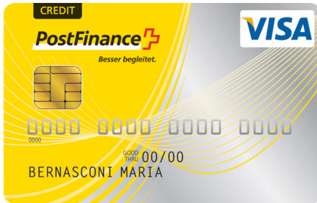
Abb. 6: Vorderseite einer Kreditkarte (Muster)