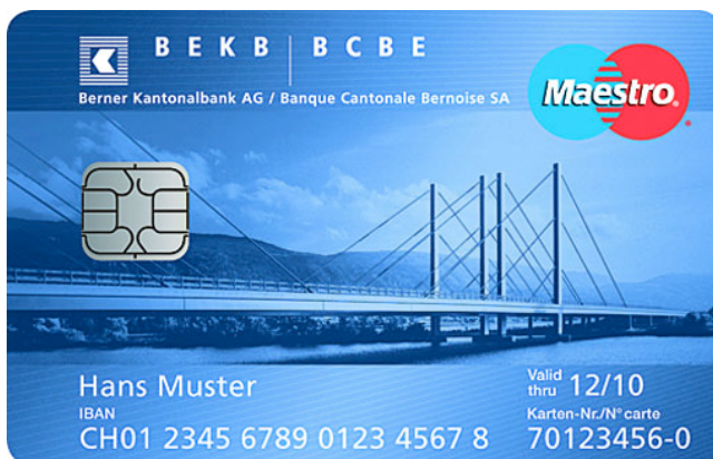
Abb. 8: Beispiel Maestro-Karte der Berner Kantonalbank

Häufige Anbieter von Debitkarten sind PostFinance, EC, Maestro und Visa Electron.