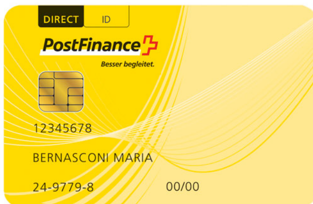
Abb. 9: Beispiel PostFinance Card

Mit 2,5 Millionen Benutzern gehört die PostFinance Card zu den meistbenutzten Debit-Karten in der Schweiz; pro Jahr werden damit Waren, Dienstleistungen und Bargeld in Höhe von rund 9 Milliarden Franken in insgesamt über 135 Millionen Einzeltransaktionen umgesetzt (Stand: 2010).